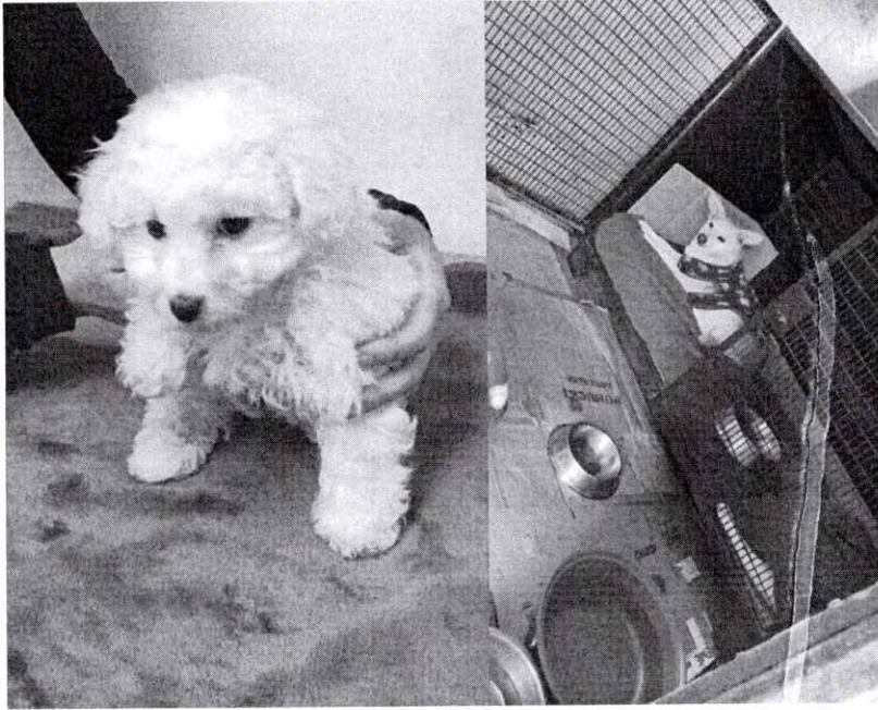
Paciente de consulta.